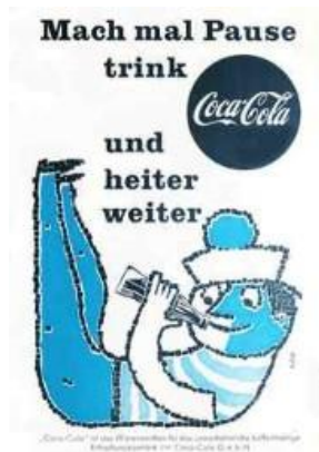
"Mach mal Pause - trink Coca Cola und heiter weiter", 1957