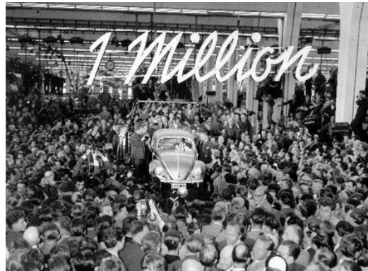
Der millionste Käfer, Wolfsburg 1955