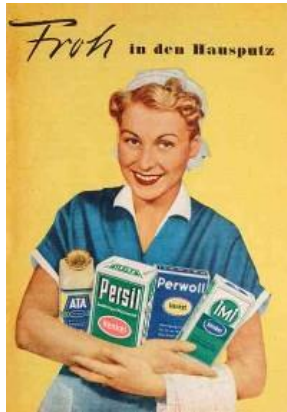
„Froh in den Hausputz“ 1953