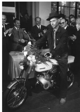
Der millionste Gastarbeiter bekam 1964 als Geschenk ein Moped